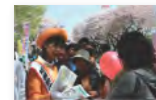
各種イベントでのPR活動 市民桜まつり

「都市のエネルギーの中心は個々の人であり、相模原をこよなく愛しています」という意味から、一文字ずつ人の顔を描いたロゴマーク