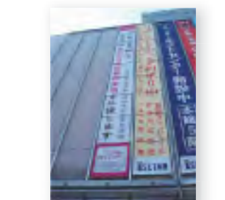
市内大型店舗などへ広告幕を掲出