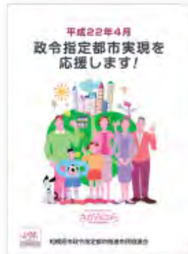
「心と心を通い合わせ、みんなで魅力満載な街にしよう!」というコンセプトでデザインされたポスター