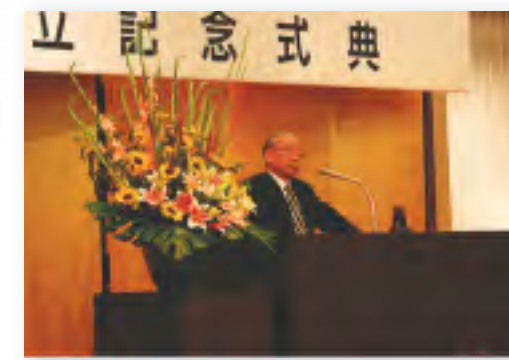
400人以上が参加した設立総会で、講演する石原信雄氏 財団法人 地方自治研究機構会長 元内閣官房副長官

今後は、さらに充実した活動により、市民意識がより一層高まっていくことが期待されます。