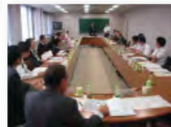
会員団体の勉強会