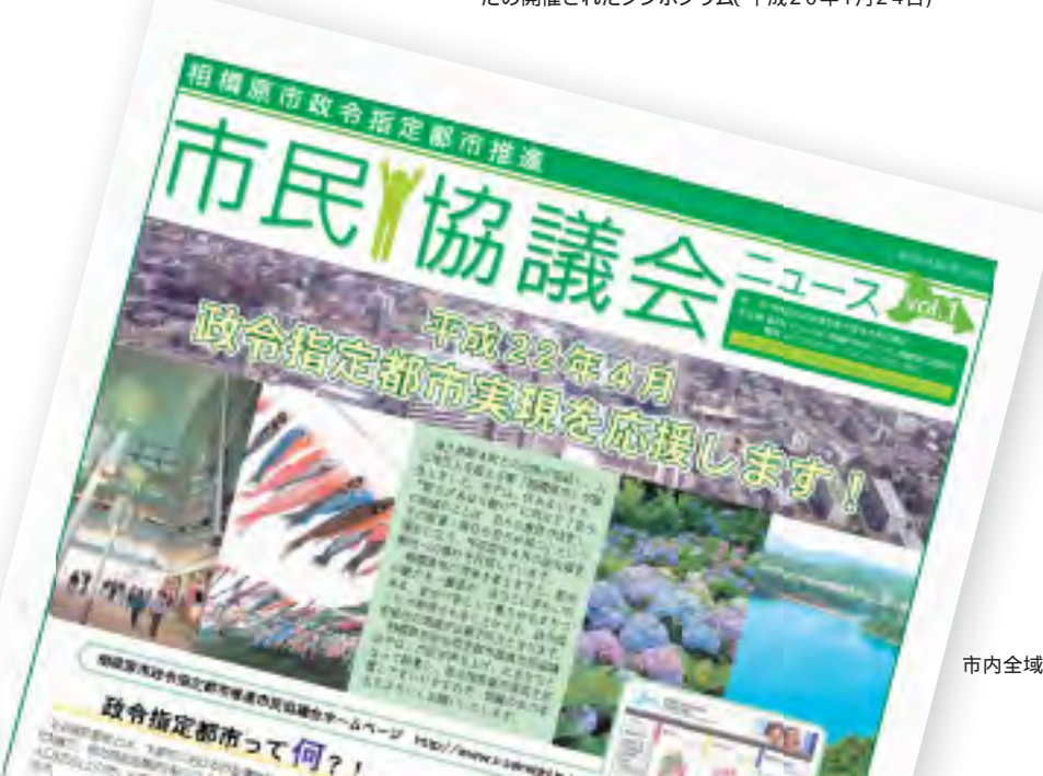
市内全域で新聞折り込みされた広報紙