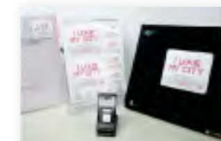
市民意識の高揚に向けさまざまなPRグッズを作成