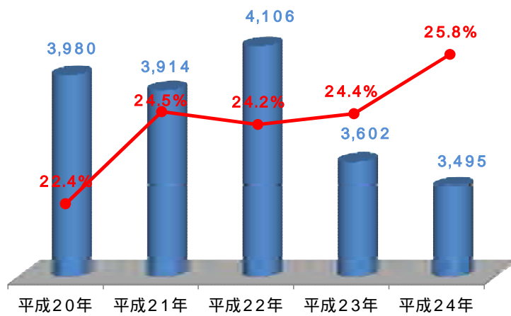
相模原市内の交通事故発生件数と高齢者の交通事故発生割合の推移