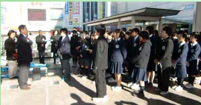
昨年度のハンドインハンドの様子