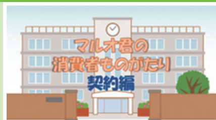
弥栄中学校の生徒と作成した消費者教育補助資料