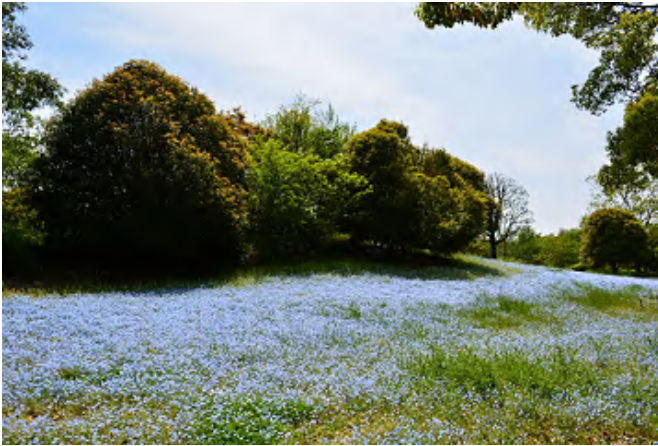
【タイトル】ネモフィラの咲く頃 【撮影場所】相模原公園 【コメント】斜面がまるで青い絨毯を敷き詰めたように広がり、ネモフィラの花がとても綺麗でした。