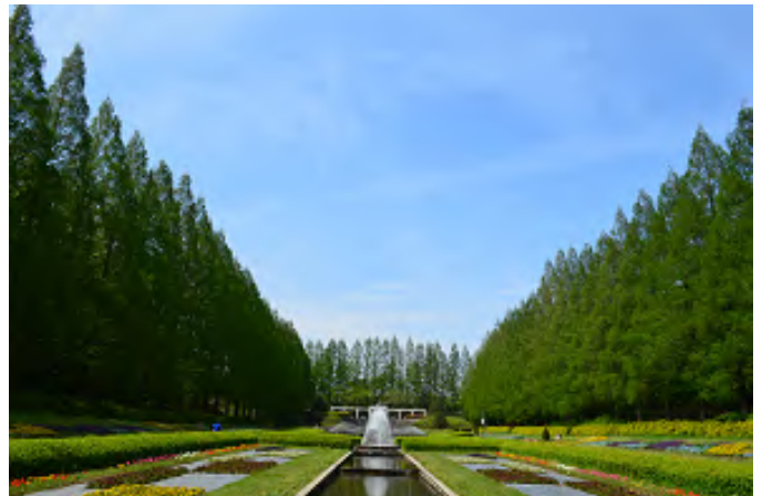
【撮影者】荻原 雅子さん 【タイトル】メタセコイヤと共に 【撮影場所】相模原公園 【コメント】青空を背景に周りはメタセコイヤの木々で囲まれ、噴水が印象的なフランス式庭園です。