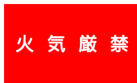
標識・掲示板の例