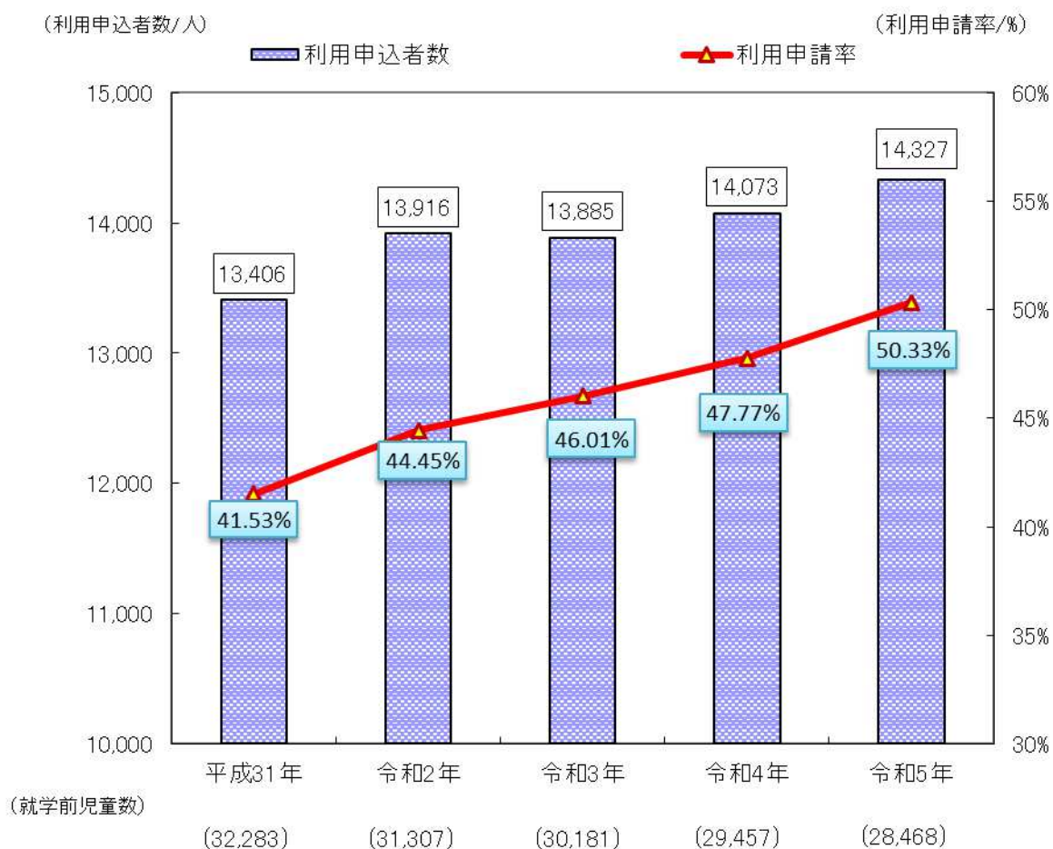
相模原市 利用申込者数、利用申請率の推移

また、利用申請率についても、本年度は50.33%(前年比2.56ポイント増)となり、共に過去最高となりました。