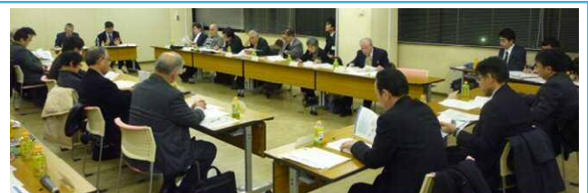
▲検討委員会の様子

の交通課題と新しい交通システムの必要性・目標について、白熱した議論が交わされました。次回の委員会においても、交通課題やシステムの必要性について、さらに議論を深めることが必要と判断され、継続して検討することとなりました。