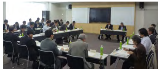
▲第2回検討委員会の様子