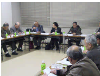
第7回地域まちづくり会議