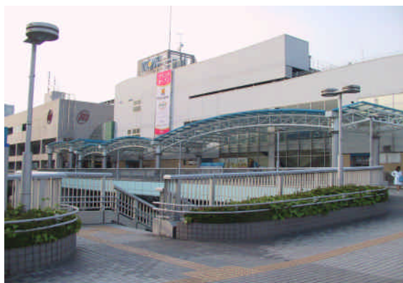
J R相模原駅 駅ビル