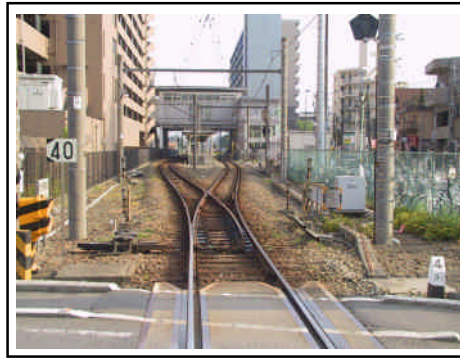
相模線の複線化・運行本数増加が必要

JR 相模線の複線化・運行本数の増加は、JR 相模線を利用する地域住民の利便性を向上させるために必要です。