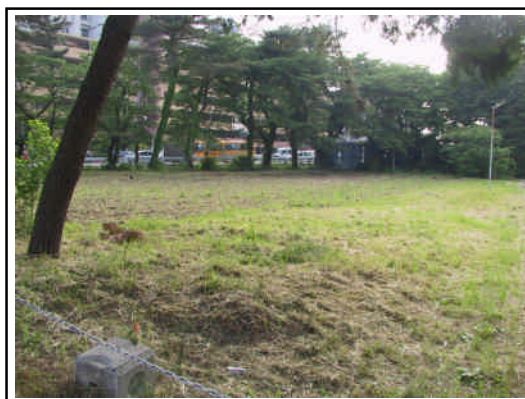
有効活用が求められる法務省庁舎跡地

法務省庁舎跡地については、研究施設等を誘致するなど、文教関連の土地利用が進むよう検討していくことが必要です。