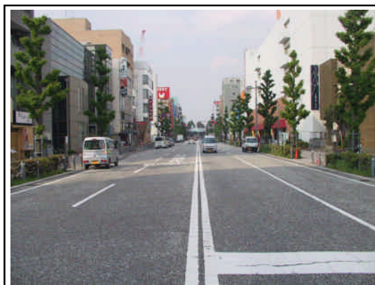
業務系機能の集積が求められる相模原駅周辺

JR 相模原駅周辺に業務系機能の集積と商業系機能の充実を図ることは、政令指定都市の表玄関として賑わいと活気のある場としていくために必要です。