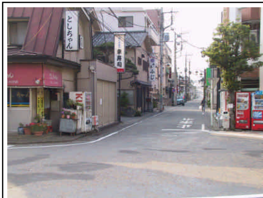
地域との連携・協力による商店街づくりが必要

商店街と地域住民とが連携・協力し、お互いが情報共有しながら活性化の取り組みを進めていくことが必要です。