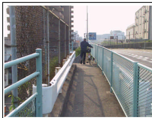
拡幅が必要な大河原陸橋上部歩道

通学路にもなっている大河原陸橋の歩道部分を拡幅することは、歩行者の安全な通行のために必要です。