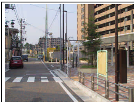
駅・商店街利用者の駐車スペースが必要（南橋本駅）

JR 相模原駅や JR 南橋本駅周辺に駐車場スペースを確保することは、買い物客や駅利用者の利便性を高めるために、また商店街の活性化のために必要です。