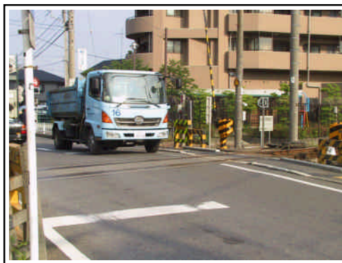
改良が必要な大河原踏切