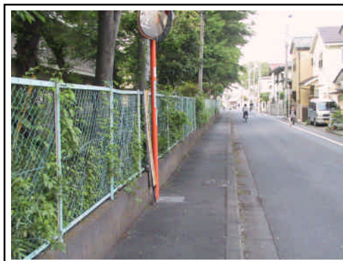
清新小学校敷地を歩道用地として確保

清新小学校の敷地の一部を歩道用地として確保することは、児童も多く歩道幅が狭い清新小学校付近における、通学の安全確保のために必要です。