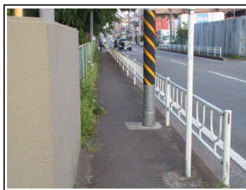
改良が必要な市道南橋本弥栄荘線歩道

市道南橋本弥栄荘線（南橋本駅 - アイワールド付近）の歩道を歩きやすくするために歩道を改良することは、歩行者等の安全な通行のために必要です。