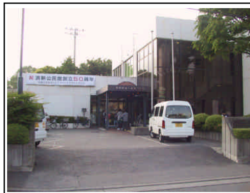
公民館など既存施設の活用が必要

公民館や学校等の既存施設に、親も子も安心して交流、活動、情報交換できるような場を設置することは、親の育児不安の解消や、子どもが健やかに育つために必要です。