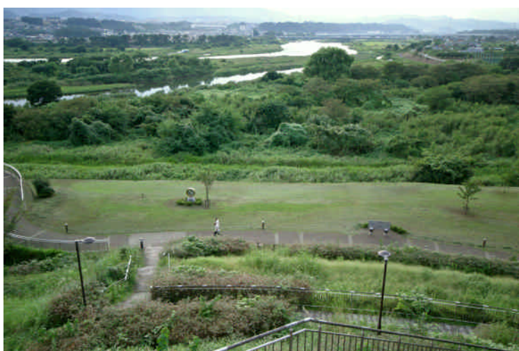
豊かな自然環境（相模川）

相模川、鳩川、姥川、八瀬川、道保川や道保川緑地、横山丘陵など、豊かな自然環境を保存するとともに、市民の憩いの場として活用を図る。