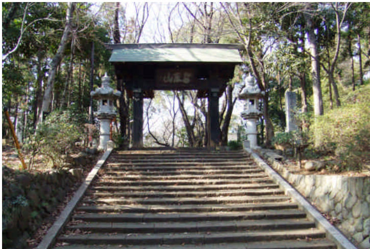
当麻山無量光寺（中門）

地域に点在する文化遺産など（当麻山無量光寺、亀形遺跡など）の保存を行うとともに、それらを線でつなぐ散策路の整備やPR活動などを含め、観光資源としての活用を図る。