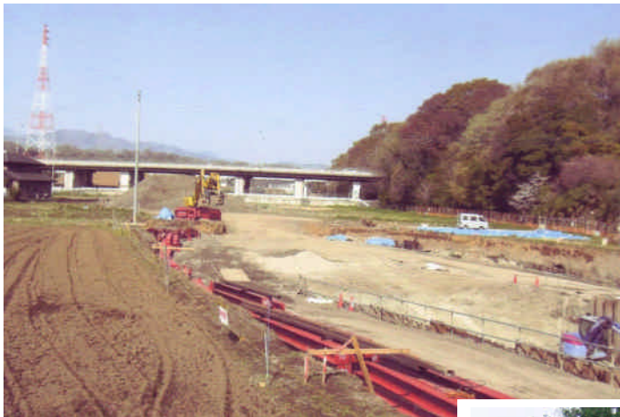
（仮称）相模原インター周辺