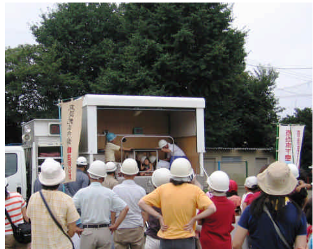
地域防災訓練の様子