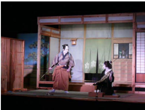
【伝統文化を守り続ける藤野歌舞伎保存会】

文化財、伝統行事、地域行事、里山文化などのPR及び伝承のための担い手を育成する。