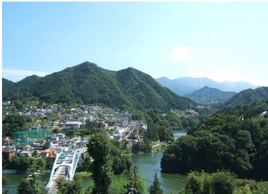
【藤野総合事務所屋上からの美しい眺め】