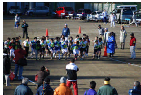
【 昨年 の 駅 伝 大 会 の 様 子 】

温泉施設を活用した健康づくり事業を推進する。 やまなみ駅伝など自然を活かした健康づくり事業を推進する。