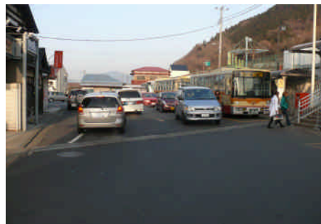
【朝夕に混雑する藤野駅前】