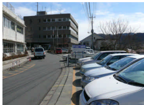
【駐車場増設が求められる公共施設 (写真は藤野総合事務所)】

自家用車での利用が主となる公共施設に、十分な駐車スペースを確保する。(グラウンド・公民館等)