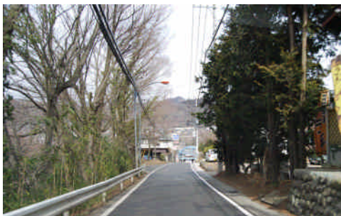
【車のすれ違いが困難な県道 76 号】