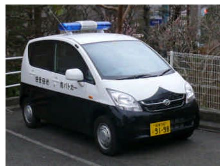
【青色回転灯装備車両】

防犯協会や自治会などの協力を得て、防犯意識の啓発やパトロール活動などを実施する。