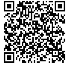
二次元バーコード

https://s-mobile.city.sagamihara.kanagawa.jp/snet-res/