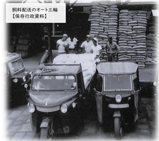
飼料配送のオート三輪 【保存行政資料】