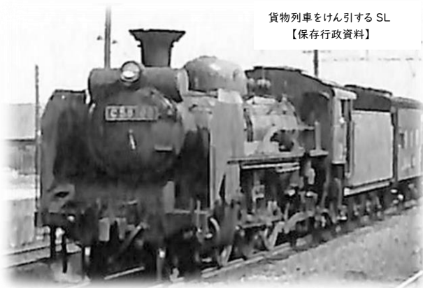
貨物列車をけん引するSL 【保存行政資料】