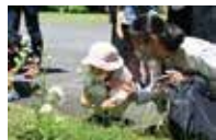
過去の生きものミニサロンの様子