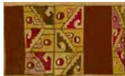
人物顔模様様 6世紀-8世紀 フリ文化

アンデスの人々は文字による記録こそ遺していませんでしたが、織物の模様は文化と創造力の記憶そのものです。鮮やかな色彩や高度な織物技術により創出された豊かな歴史を貴重な文化財からお楽しみください。