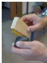
作った道具で火おこし体験