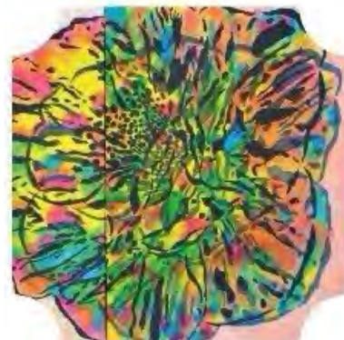
顔 (染色/丹羽 希)