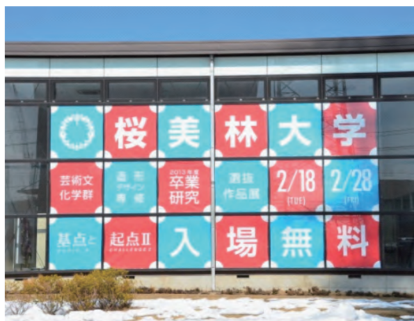
建物の四方を飾った壁広告