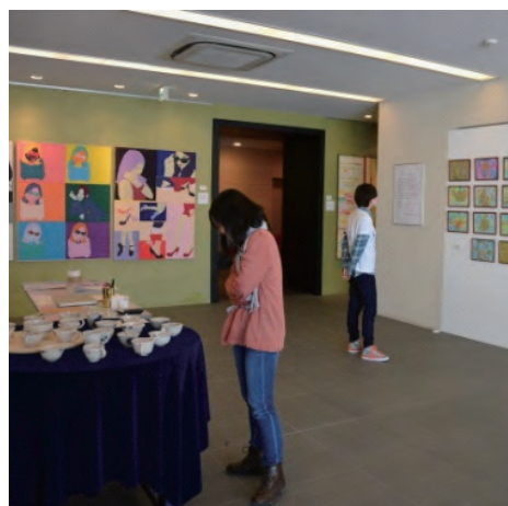
卒業研究作品展示風景①