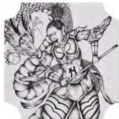
十二神明王 (ペン画/櫻本 光宏)