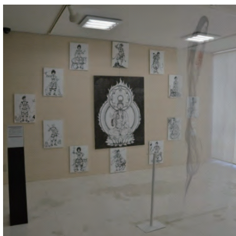
卒業研究作品展示風景②