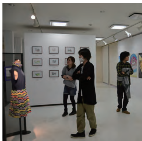
卒業研究作品展示風景③