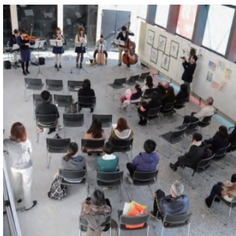
ミニコンサートの様子