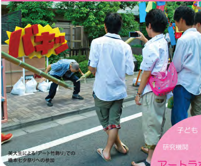
美大生による「アート竹飾り」での橋本七夕祭りへの参加

建物内の活動だけでなく、広く街に出て、地域の方々と交流を重ねながら、新しいごきをつくり出します。