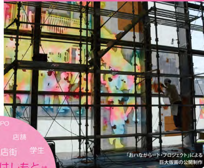
「おハながらード・プロジェクト」による巨大版画の公開制作

アーティストや美大生たちが作品をつくります。その制作の過程をご覧いただくこともできます。また、子どもたちや市民と一緒に作ることもあります。