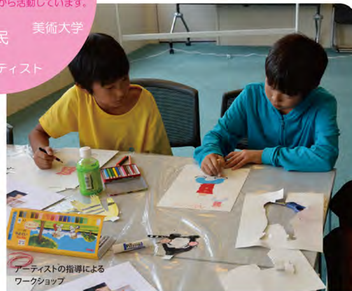
アーティストの指導によるワークショップ