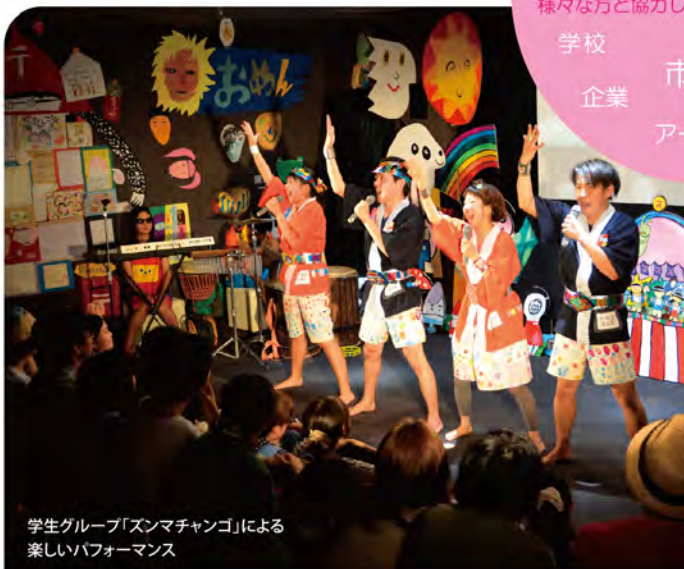
学生グループ「ズンマチャング」による楽しいパフォーマンス

NPO 子ども NPO 子ども 研究機関 商店街 学生 学校 企業 市民 美術大学 アーティスト アートラボはしもとは、様々な方と協力しながら活動しています。