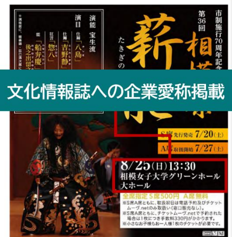
文化情報誌への企業愛称掲載