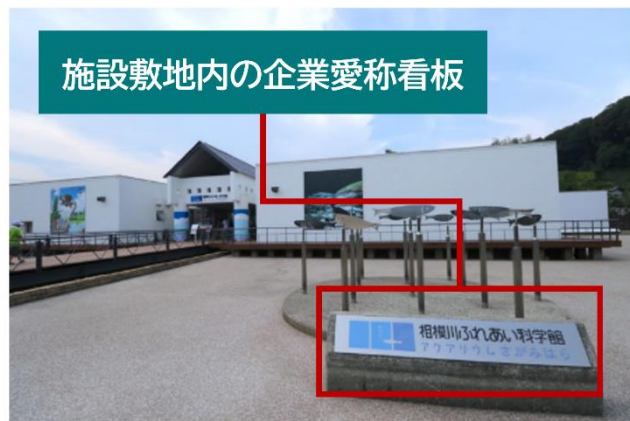
施設敷地内の企業愛称看板