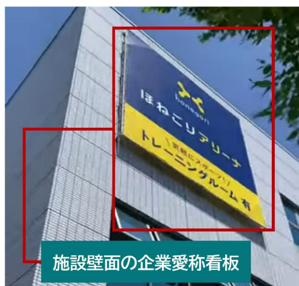
施設壁面の企業愛称看板