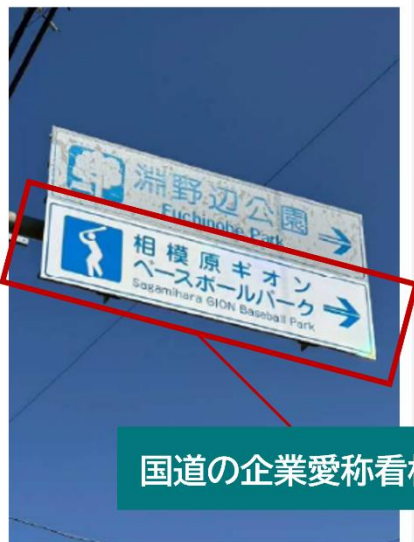
国道の企業愛称看板