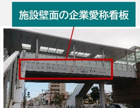
施設壁面の企業愛称看板