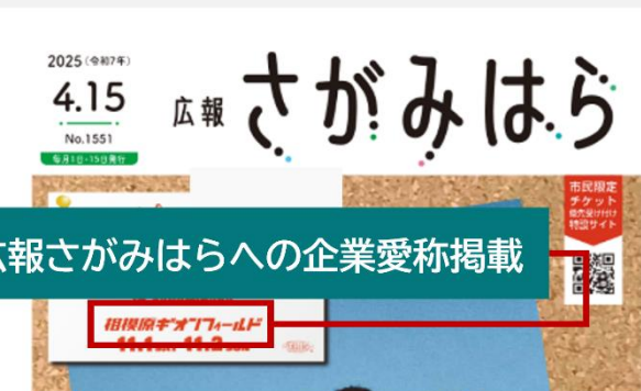
広報さがみはらへの企業愛称掲載