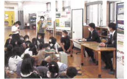
児童と市職員の意見交換の様子

児童たちには、「これからも地域に愛着を持ち、相模線にたくさん乗ってください」と伝えました。