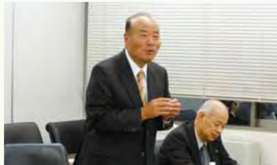
あいさつする成川会長