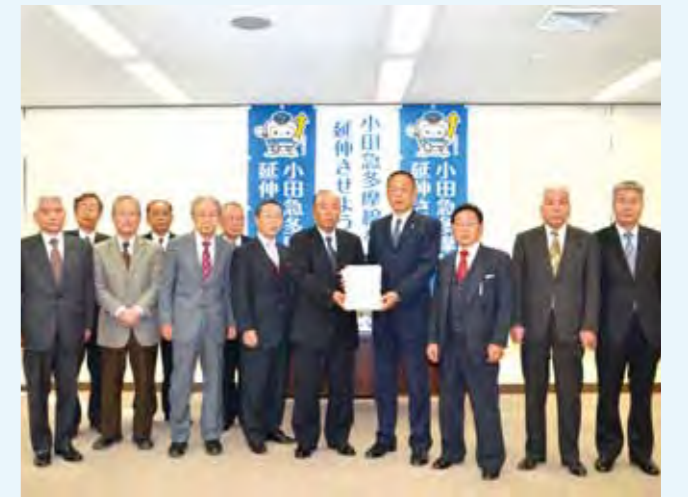
皆様の想いを市長へ届けました。