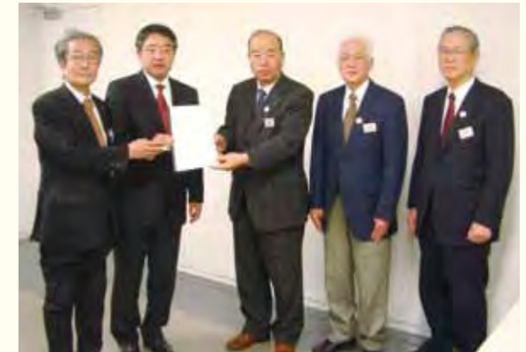
小田急電鉄(株)への要望書提出の様子