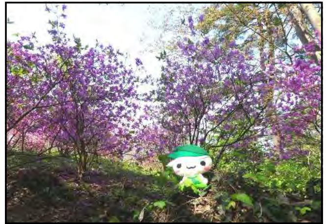
(山頂のミツバツツジも見どころです)