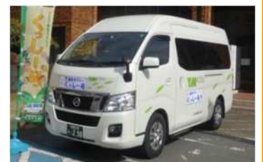
くっしー号の車両