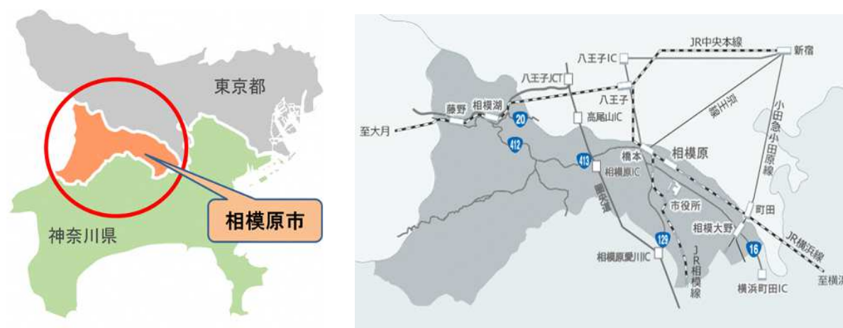
図 1 相模原市の概況(相模原市ホームページより)

相模原市は、戦後は東京の近郊都市として急速に都市化が進み、東京や横浜のベッドタウン、また、内陸工業都市として発展してきた。これに伴い、特に昭和 40 年代から 50 年代前半にかけて人口が急増している。市内には JR 東日本、京王電鉄、小田急電鉄合わせて 6 つの鉄道路線が通り、近年は、圏央道相模原 IC と相模原愛川 IC が開業している。