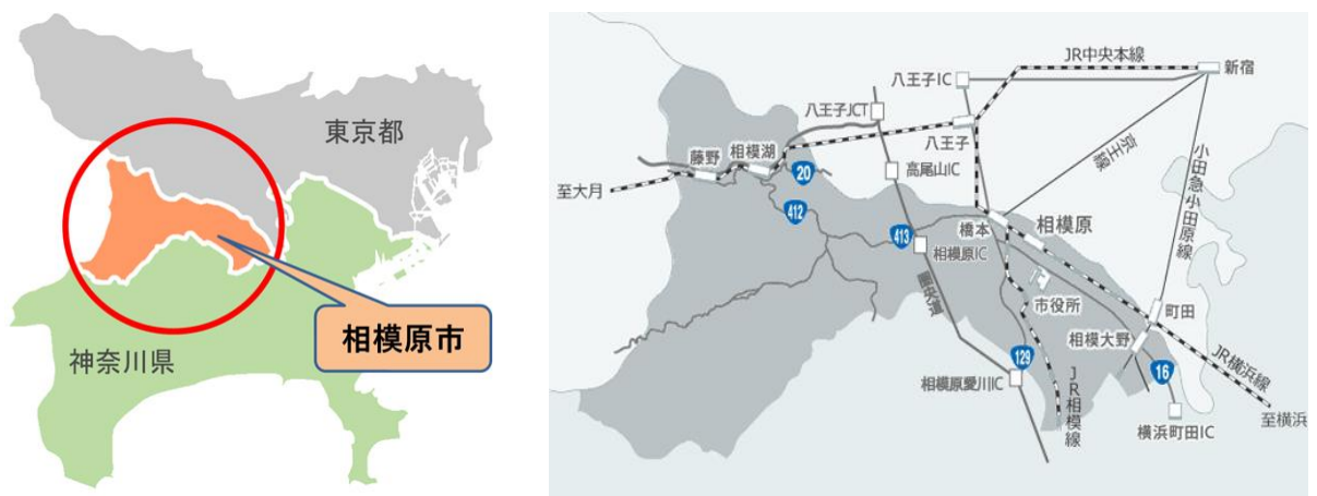
図 1 相模原市の概況(相模原市ホームページより)

鉄道は、首都圏の環状交通軸である JR 横浜線、放射交通軸である小田急線(小田原線・江ノ島線)及び京王相模原線、県央地区の南北交通軸である JR 相模線、そして JR 中央本線の 6 路線があり、17 の駅が設置されている。