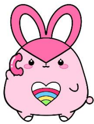
公式マスコットキャラクター さがみみちゃん