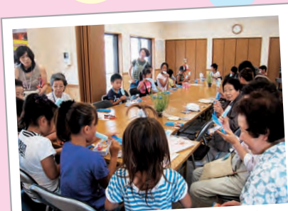
子どもたちとの交流 (麻溝地区)