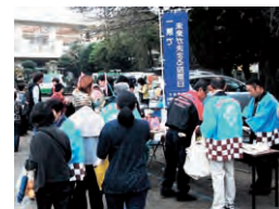
イベント会場で啓発グッズを配布

南区明推協では、各地区の委員が地域と連携してイベント会場などで啓発活動や、南区内の全委員を対象に視察研修会や講座などを開催するなど、知識の向上と委員同士の親睦を深めています。