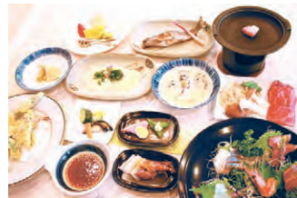
料理長おすすめコース(和食)