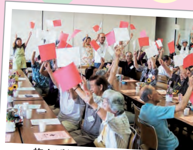
旗上げゲーム (大野中地区)