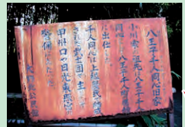
老朽化した案内板