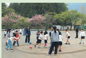
縦割り班での遊び

4年生～6年生で構成するマーチングバンドは地域のイベントにも参加し大活躍しています。