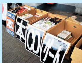
回収ブースのイメージ

市内での地域活動としては、本市初のJリーグチームをめざすSC相模原に対し、23年末から「ボランティア宅本便」という宅配買い取りシステムを通して本やCD、DVD、ゲームソフトの買い取り金額を寄付し、活動の運営を応援しています。また24年夏頃には、同チームがホームスタジアムとする相模原麻溝公園競技場で行われる公式戦で、サポーター等に不要な本などを寄付してもらう回収ブースを設置して、同社が買い取った金額がSC相模原の活動を支えるというイベントも予定しています。