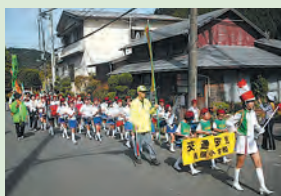
交通パレードに参加するマーチングバンド