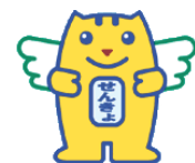
明るい選挙キャラクター「選挙のめいすいくん」

明推協は、市・区選挙管理委員会と連携して、民主政治の基盤である選挙が「明るく」「正しく」「公正に」行われるよう活動しているボランティア団体です。