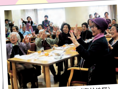
みんなでリズム体操 (東林地区)