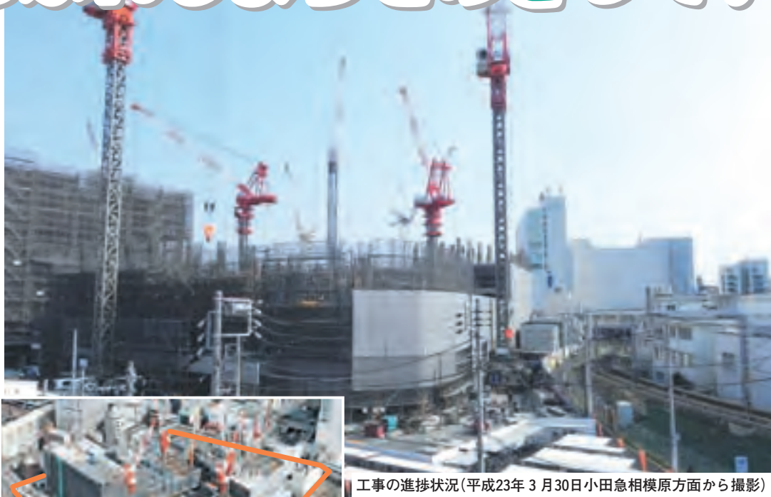
工事の進捗状況(平成23年3月30日小田急相模原方面から撮影)