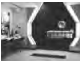
コスミックシアター

天文展示室が「宇宙とつながる」をテーマにリニューアルオープンします。宇宙とのつながりを考えるヒントがたくさん詰まった展示をお楽しみください。