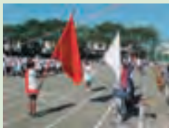
力を合わせて競う運動会