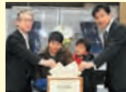
子どもたちとメッセージを贈るJAXAの川口淳一郎教授(左)と阪本成一教授(右)

同コーナーには小惑星探査機「はやぶさ」の5分の1模型も設置され、さまざまな困難に直面しながらも大きな成果を挙げた「はやぶさ」とともに、被災地への励みや1日も早い復興を願う皆さんのメッセージを、被災地へ届けます。