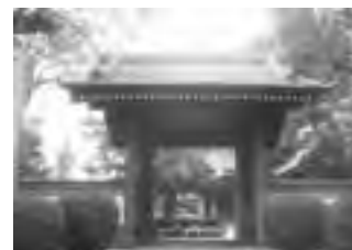
能徳寺山門(南区磯部)