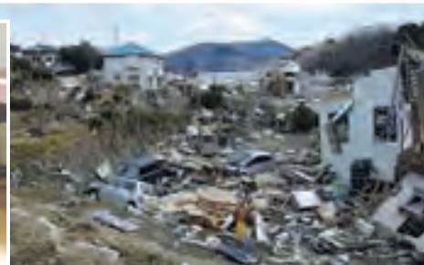
▲震災で甚大な被害を受けた岩手県大船渡市