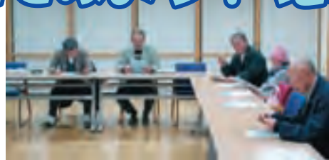
多くの人に利用してもらえるよう検討やPRを実施

乗合タクシーは、津久井地域を対象にした、セダン型やワゴン型の車両を使った乗合型の公共交通です。地域で乗合タクシーを導入したいと検討する際には、まちづくりセンター等で配布している「乗合タクシー導入の手引き」をご活用ください。