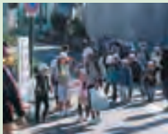
当麻田ウォークラリー