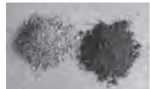
粗いチップ 細かいチップ