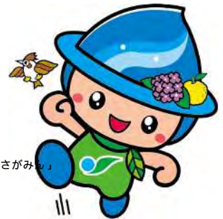
市マスコットキャラクター「さがみん」