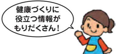
ウェルネスさがみはらB館3階