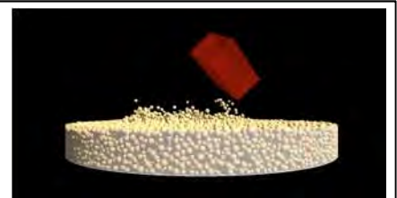
(左) パトリック・ミッシェルさん(コートダジュール天文台 宇宙物理学者) 演題: 「はやぶさ2」- 若い世代に科学の魅力と面白さを伝えるミッション (右) リュウグウ表面でマスコット着陸機がバウンドする様子