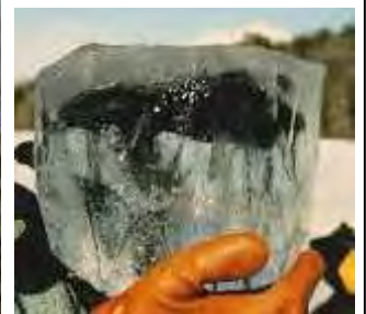
(左) マイケル・ゾレンスキーさん(NASA ジョンソン宇宙センター 宇宙科学者) 演題: 「はやぶさ2」で地球の水の起源を突き止める (右) 氷の中に発見されたタギシュ・レイク隕石。最も多くの水を含む隕石だと言われている。

日 時 平成 29 年 12 月 2 日 (土) 開場 13:30 講演 14:00 ~ 16:00 会 場 相模原市立博物館 大会議室 定 員 180 人 (事前申込み: 申込順) 定員になり次第締切ります 参加費 無 料 申込方法 市コールセンター (042-770-7777) へ 受付期間 11 月 15 日 (水) から 12 月 1 日 (金) まで (午前 8 時から午後 9 時まで)