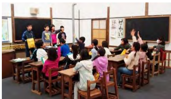
昔の教室ジオラマ