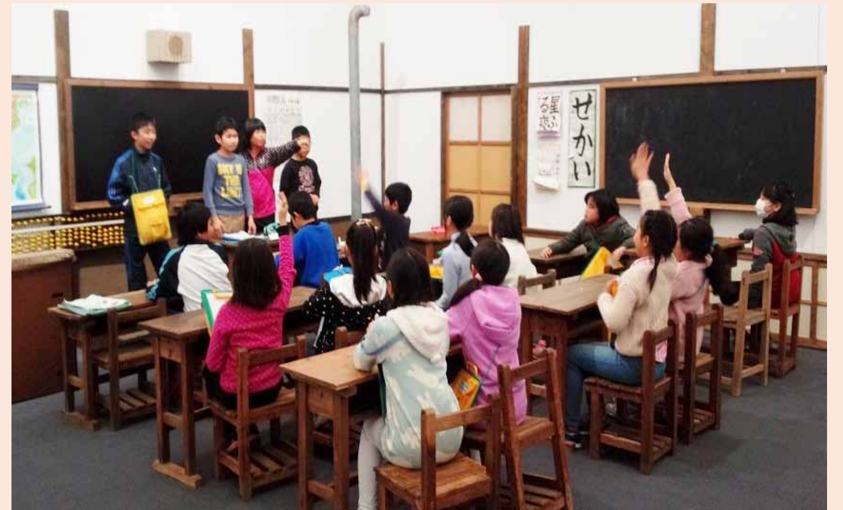
昔の教室ジオラマ