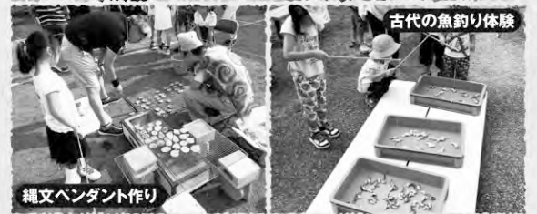
古代の魚釣り体験