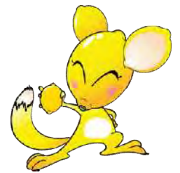
レモンちゃん