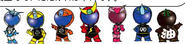
分別戦隊シゲンジャー銀河 ©相模原市