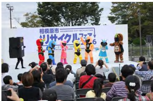
分別戦隊シゲンジャー銀河ショー