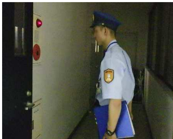
消防用設備等の確認状況 (自動火災報知設備)