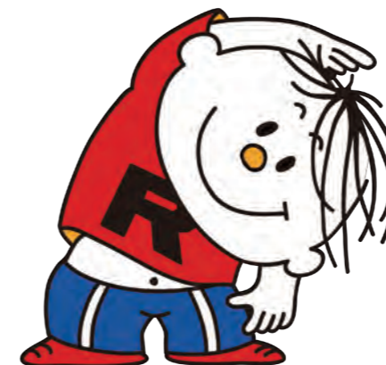
イメージキャラクター ラタ坊