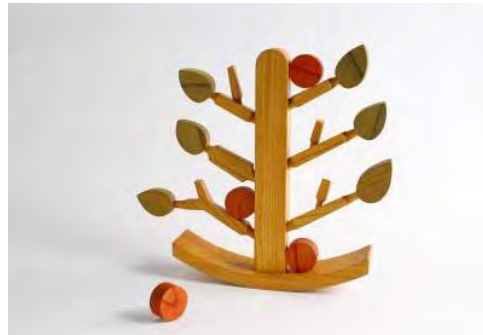
販売予定価格 30,000 円（税込）