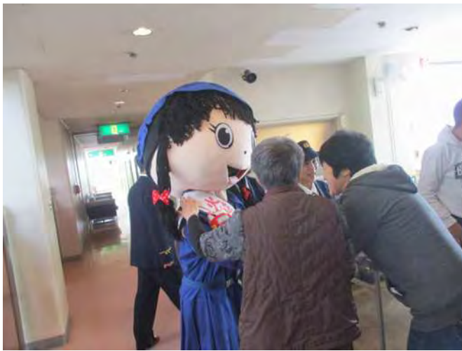
施設利用者に大人気のあじさいちゃん