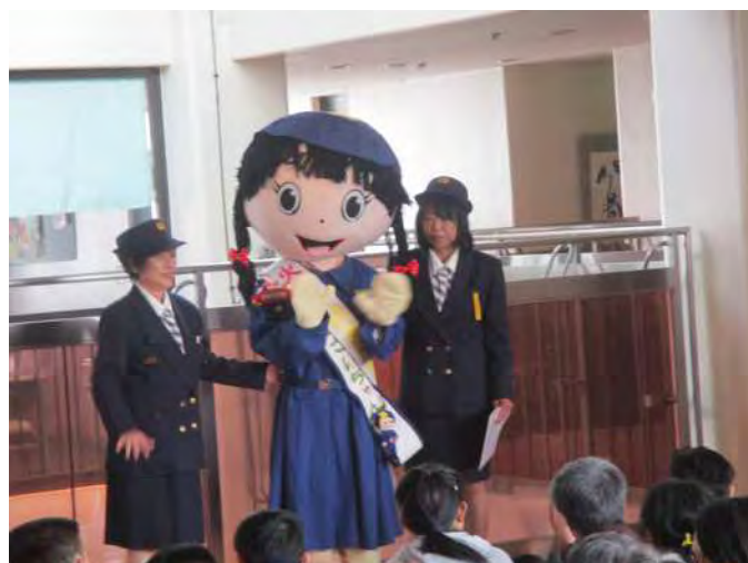
消防団女性分団とマスコットキャラクター あじさいちゃんの紹介