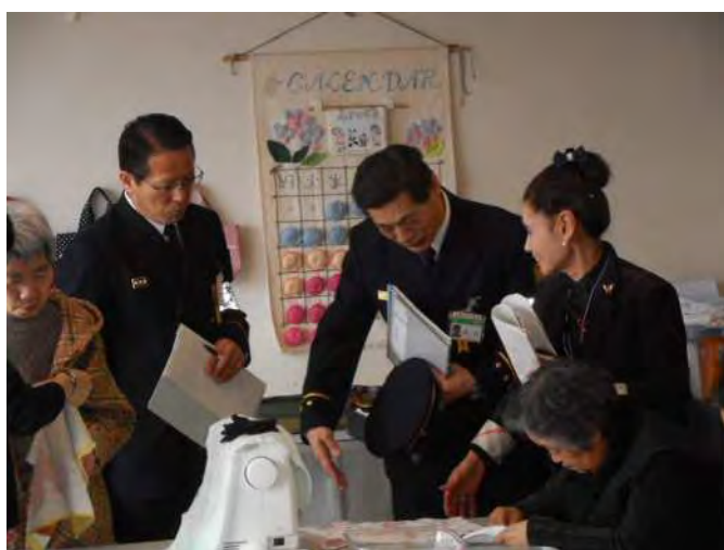
施設利用者の活動について説明を受ける (製作した刺繍を販売し活動をしている)