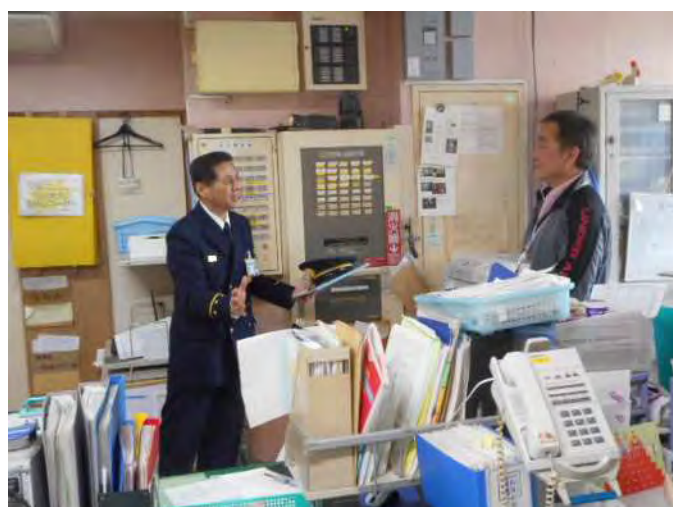
発見、通報、消火、避難の一連の流れについて説明