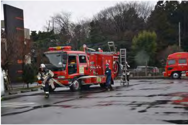
放水準備を行なう田名消防隊