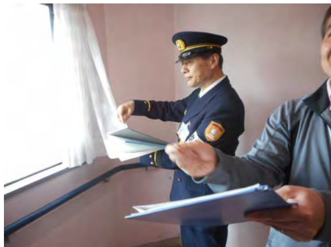
防災カーテンを確認