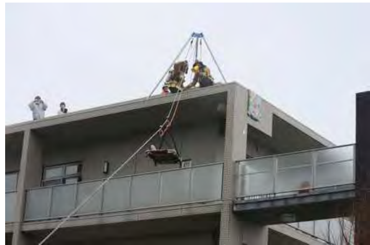
屋上の要救助者を救出する田名特別救助隊