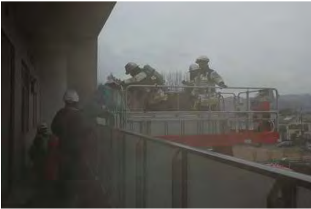
要救助者を救出する緑が丘高所救助車