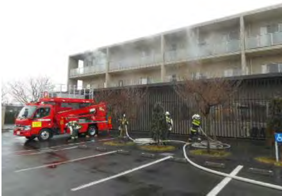
建物3階から白煙上昇中