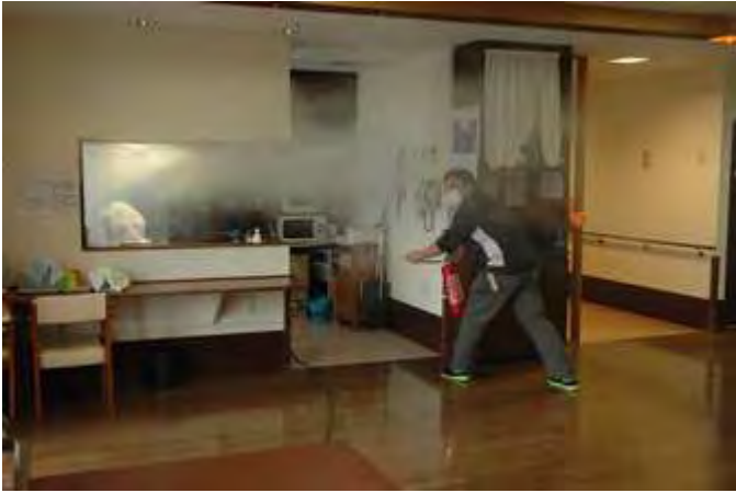
施設職員による懸命な初期消火