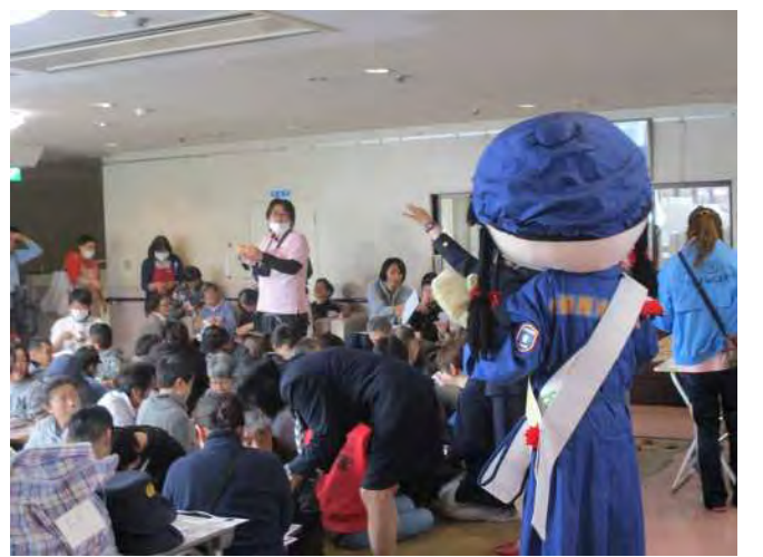
女性分団による火災予防普及啓発