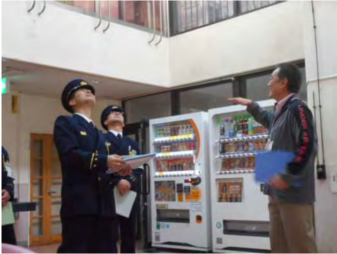
豎穴区画の排煙設備を確認