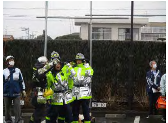
中隊長より消防団へ協力を要請