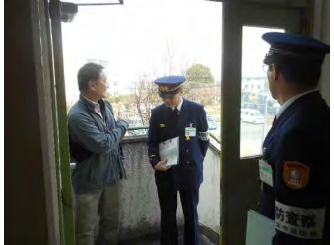
屋外避難階段について確認