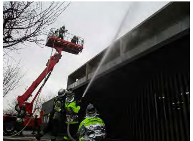
消防団の援護注水を受け要救助者の救出に向かう緑が丘高所救助車