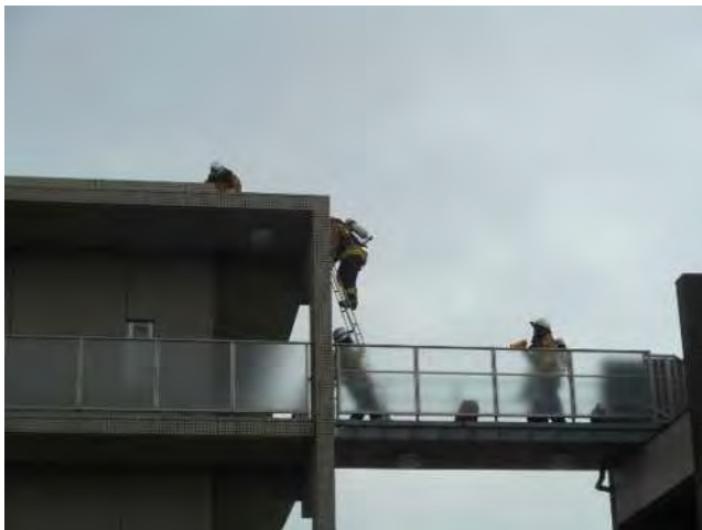
屋上の要救助者の救出へ向かう田名特別救助隊