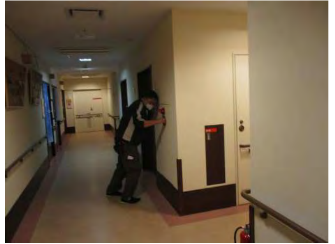
発信機を押しサイレンを鳴動させる施設職員