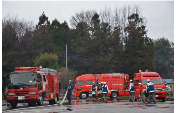
要救助者を救急車へ搬送する田名救急隊