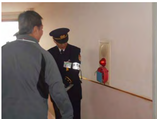
発信機のカバーについて質問 (入所者によるいたずら防止)