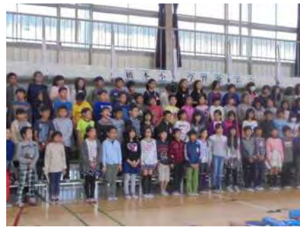
< 11月19日に向けて練習に取り組む児童 >