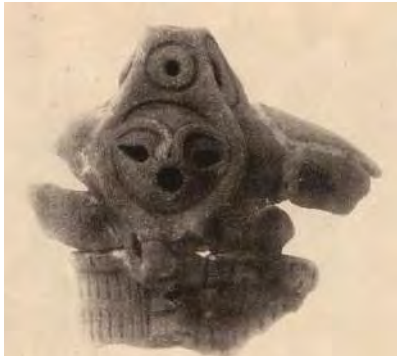
大山柏の調査で出土した顔面把手 (勝坂式土器の特徴のひとつ)

今年、 おおやまかしわ 大山 柏（明治期軍人として名高い いわお 大山 巖の次男）が、現在の南区磯部の勝坂で、大正 15 年（1926）10 月 3 日に発掘調査を行ってからちょうど 90 年となります。