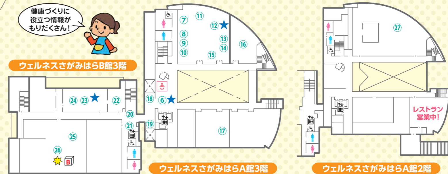
ウェルネスさがみはらA館3階