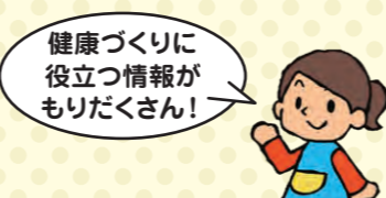
ウェルネスさがみはらB館3階