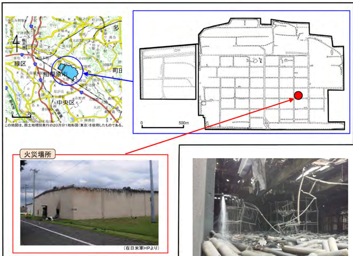
図1 相模総合補給廠の位置図

在日米陸軍相模総合補給廠内の倉庫（神奈川県相模原市） （鉄筋コンクリート造（一部鉄骨造）平屋建）