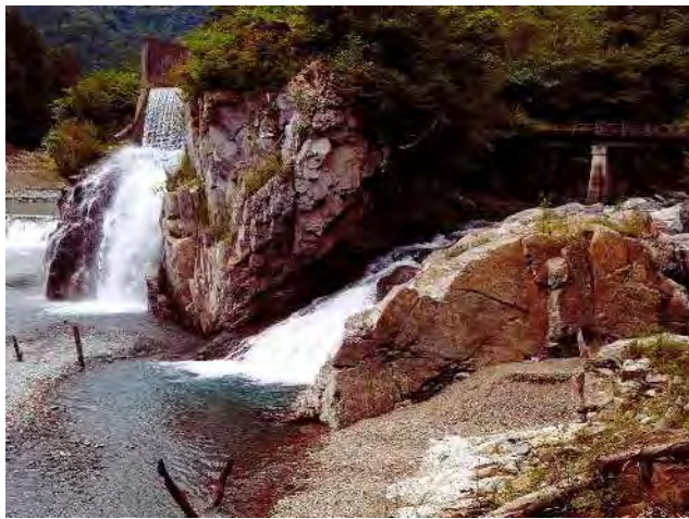
テーマ賞 「豊かな流れ」