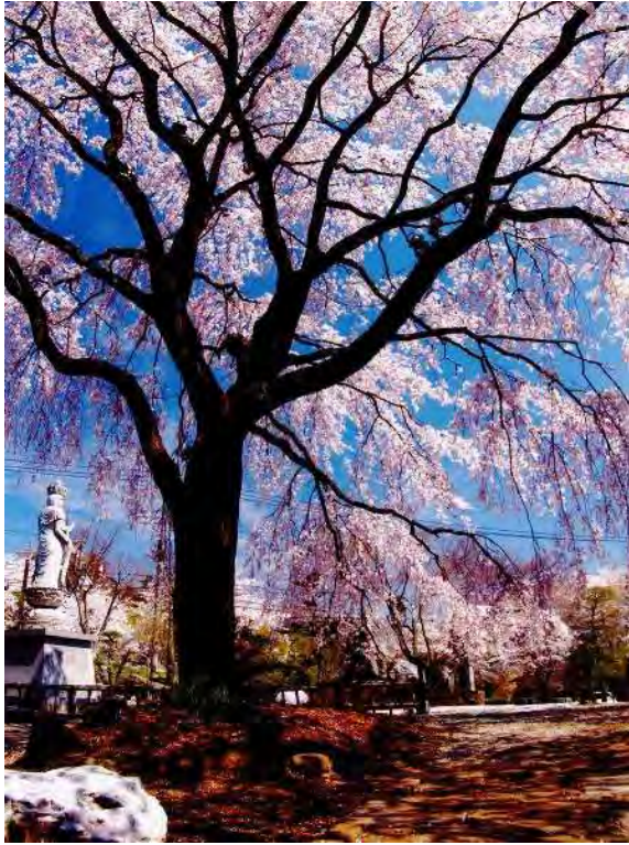
最優秀賞 「桜につつまれて」