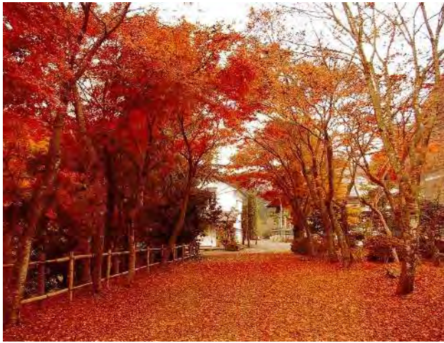
季節賞 秋 「散り紅葉の参道」