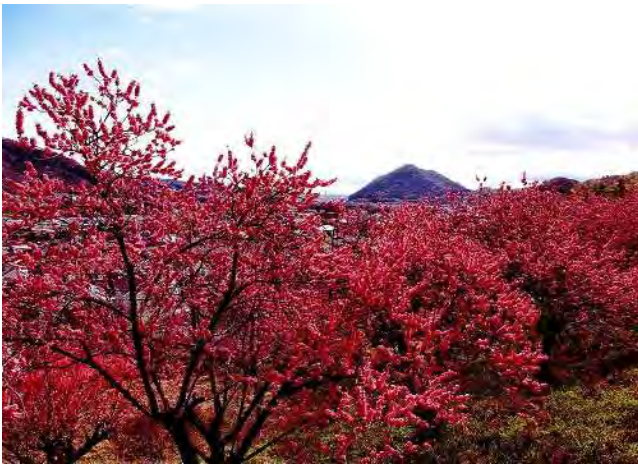
季節賞 春 「花桃の展望」