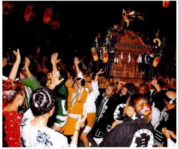
季節賞 夏 「渡御神輿」