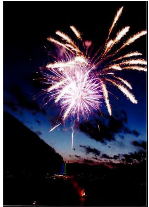
季節賞 冬 「すてきな花火」