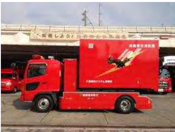
大型除染システム搭載車（相模原消防署配置）