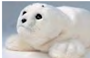
メンタルコミットロボット (癒しロボット)「パロ」