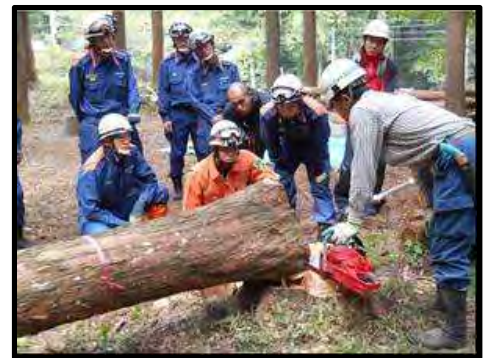
講師による伐木に係る安全管理指導