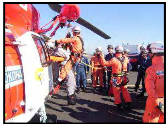
横浜市消防局ヘリポートでの訓練の様子