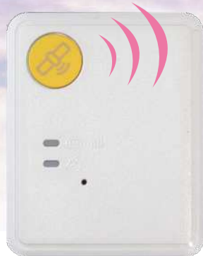
原寸大(縦47.5mm 横38.5mm 厚さ11.85mm)

専用の端末を貸し出し、利用者がひとり歩きする等行方がわからなくなった際に、GPS機能を利用して居場所をお伝えするサービスです。(委託先:ホームネット株式会社)