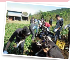
▲ゆっくりと流れる時間の中での自然体験