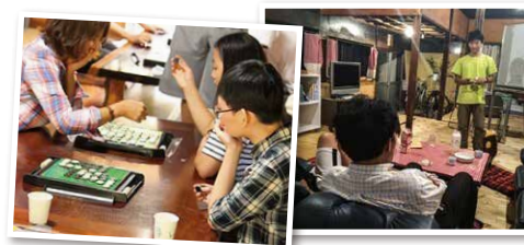
▲学び直し・体験学習