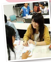
▲大学生ボランティアの協力による学習支援