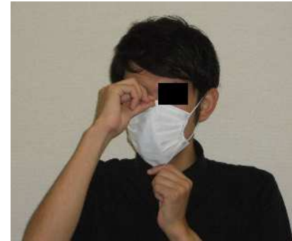
プリーツをしっかり広げ、口と鼻を覆う