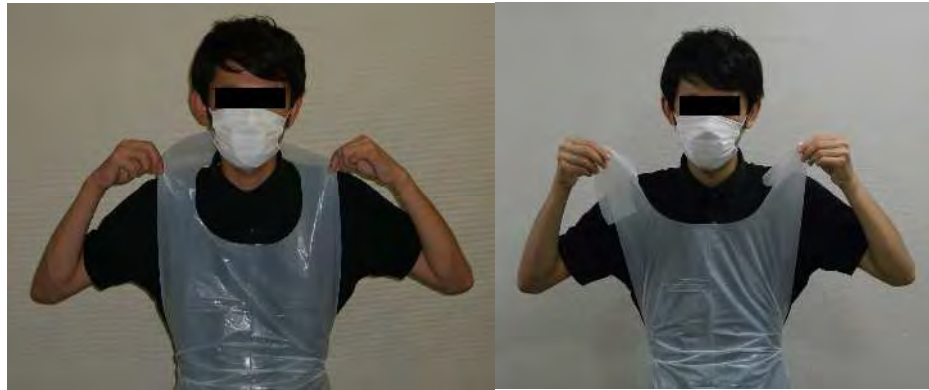
首の部分を引きちぎる