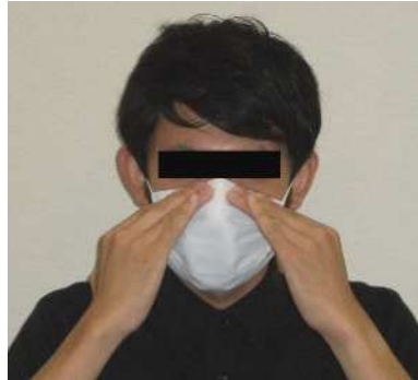
鼻あて部分を両手で鼻にフィットさせる