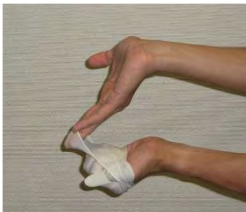
静かに裏返しになるよう引 き抜く