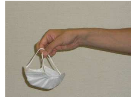
外す場合は、ゴム部分を持ち、 表面には触れない