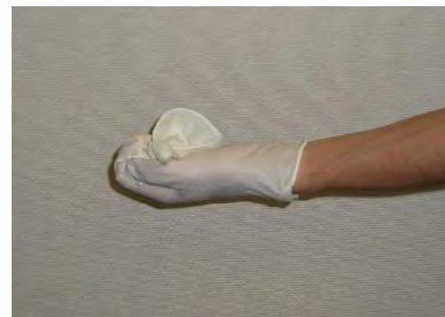
脱いだ方を持ったまま