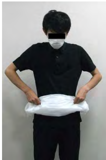
裾を持って腰部分 まで丸め上げる