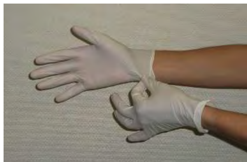
片手で反対側の手首部分を掴む