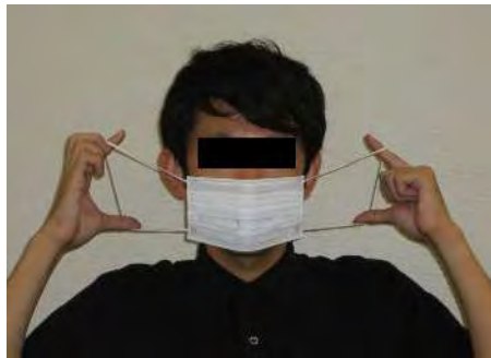
鼻あて部分を上にして着ける