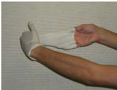
裏返しになるよう静かに引き抜く