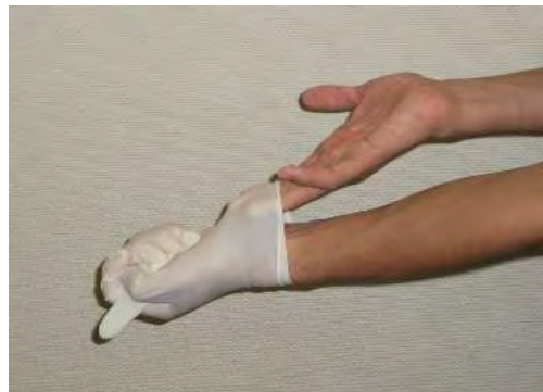
素手で表面に触れないよう 手袋の内側へ手を入れる