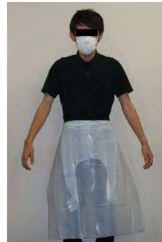
上半身部分を前に 垂らし二つ折りに