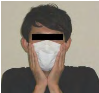
両側の頬部もフィットさせる